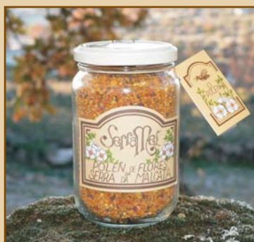
Pólen de Flores Serra da Malcata (300g / 500g) Pollen from Serra da Malcata