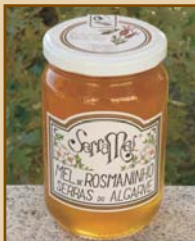
Mel de Rosmaninho Serras do Algarve (300g / 500g) Wild Lavender Honey From Algarve