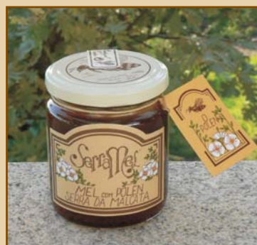
Mel com Pólen Serra da Malcata (300g / 500g) Honey with Pollen from Serra da Malcata