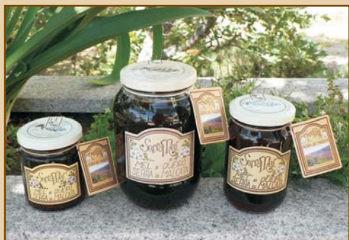
Mel de Queiró Serra da Malcata (300g / 500g / 1100g) Heather Honey from Serra da Malcata