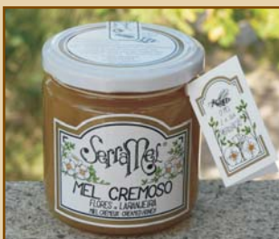
Mel Cremoso Flores de Laranjeira do Algarve (420g) Orange Blossom Creamed Honey from Algarve