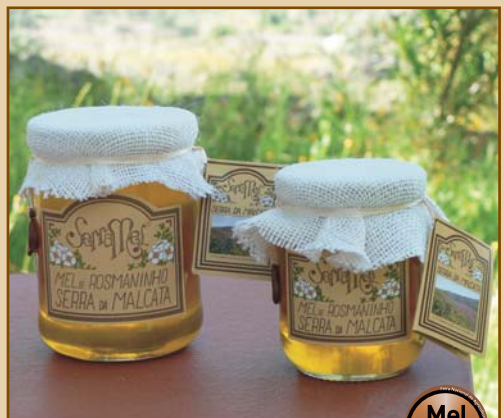
Mel de Rosmaninho Serra da Malcata Wild Lavender Honey from Serra da Malcata (300g / 600g)