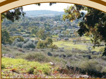
Manhã na Euromel... Euromel in the morning...

Granolas Serramel are "Breakfast Cereals" produced with wholegrain oat flakes, honey and seeds - slightly toasted. No sucrose added. By choosing our Granolas with Honey you are helping to support yourself by eating a breakfast cereal which contains slow energy release foods, to sustain you through your busy day.