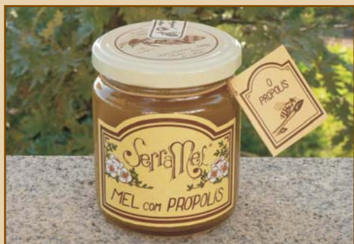
Mel com Própolis (300g) Honey with Propolis