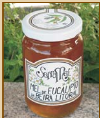
Mel de Eucalipto da Beira Litoral (300g / 500g) Eucalyptus Honey from Beira Litoral