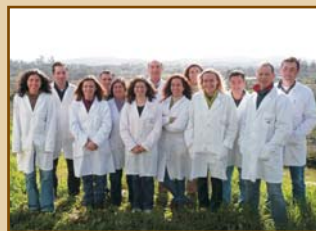
A equipa Euromel Euromel Team