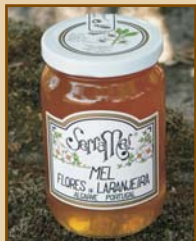
Mel de Laranjeira do Algarve (500g) Orange Blossom Honey from Algarve