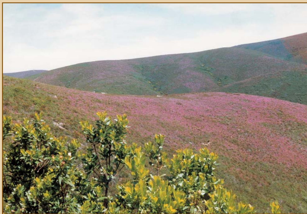
A Urze Queiró em flor na Serra da Malcata Heather in bloom in Serra da Malcata

PRODUTOS NATURAIS DAS ABELHAS NATURAL BEE PRODUCTS