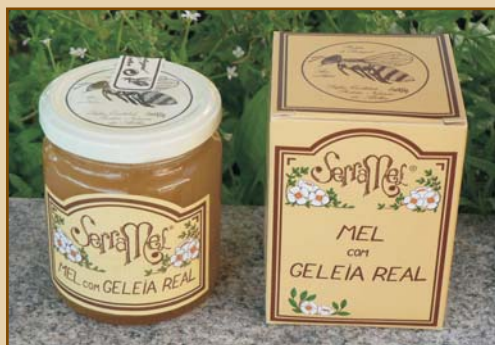
Mel com Geleia Real (300g) Honey with Royal Jelly