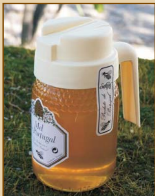
Mel de Portugal com Doseador (500g) Honey from Portugal with Doser

Para lhe oferecer uma maior variedade, Serramel selecciona, de norte a sul de Portugal, os nossos melhores méis de Portugal, os nossos melhores méis de Eucalipto, de Rosmaninho e de Laranjeira.