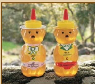
Urso de Mel de Rosmaninho / Ursa de Mel de Laranjeira (340g) Wild Lavender Honey Bear / Orange Blossom She Honey Bear