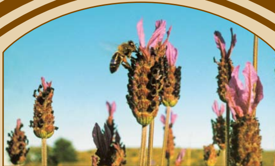
Abelha no Rosmaninho A bee on a wild lavender flower