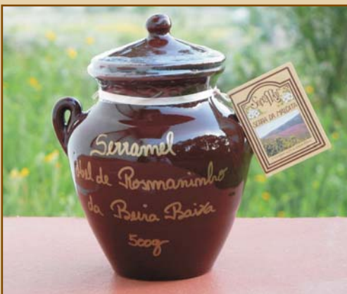
Pote de Mel de Rosmaninho Beira Baixa (500g) Wild Lavender Honey Ceramic Jar