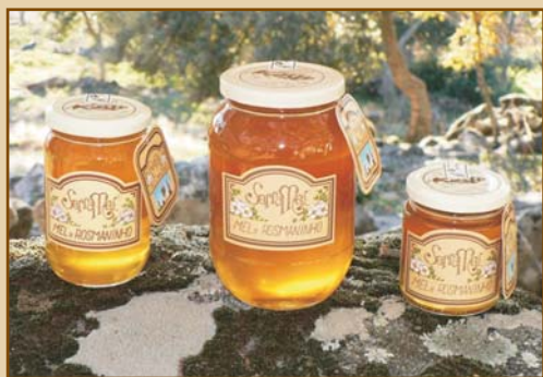
Mel de Rosmaninho Serramel (300g / 500g / 1100g) Wild Lavender Honey Serramel