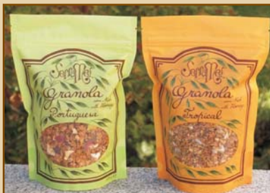
Granola Portuguesa - com frutas portuguesas (430g) Granola Tropical - com frutas tropicais (430g) Portuguese Granola - with portuguese fruits Tropical Granola - with tropical fruits

As Granolas Serramel são "Cereais de Pequeno Almoço" produzidos com cereais integrais, mel e sementes - levemente torrados. Sem adição de açúcar (sacarose). Proporcionam uma libertação lenta e progressiva de energia, ao longo de um activo dia de trabalho.