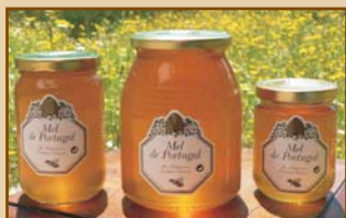
Mel de Portugal - Rosmaninho (300g / 500g / 1000g) Wild Lavender Honey from Portugal

To offer you a wider variety, Serramel selects, from north to south of Portugal, our best Eucalyptus, Wild Lavender, and Orange Blossom honeys.