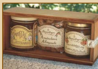
Caixa Madeira com três produtos (Mel de Rosmaninho 300g + Amêndoas Beirabaga 150g + Doce de Abóbora com Noz 270g) Wooden Box with three products (Wild Lavender Honey 300g + Beirabaga Almonds 150g + Pumpkin Jam with Walnut 270g)

Prefira Qualidade Produtos Naturais das Abelhas