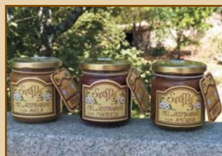
Mel com Avelã / Mel com Framboesa / Mel com Amêndoas (240g) Honey with Hazelnuts / Honey with Raspberries / Honey with Almonds