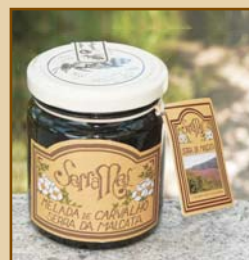
Melada de Carvalho Serra da Malcata (300g) Oak Honeydew from Serra da Malcata