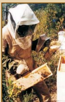
1981 - Apicultor com favo de Mel Beekeeper with Honey Comb