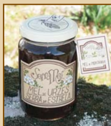
Mel de Urzes Serra da Estrela (300g / 500g / 1100g) Heather Honey from Serra da Estrela