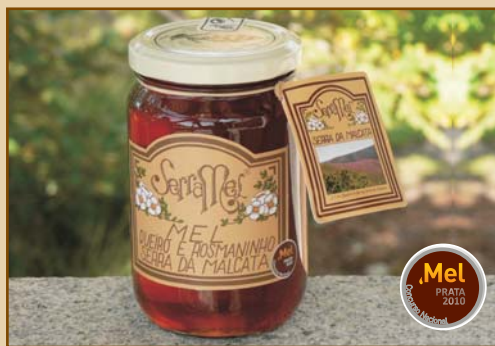
Mel de Queiró e Rosmaninho Serra da Malcata (300g / 500g / 1100g) Heather and Wild Lavender Honey from Serra da Malcata