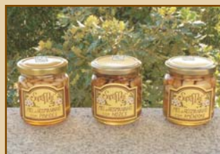
Mel com Pinhões / Mel com Nozes / Mel com Amêndoas (240g) Honey with Pinenuts / Honey with Walnuts / Honey with Almonds