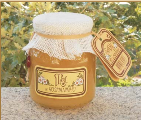
Mel Rosmaninho Lacre Wild Lavender Honey (jute cover) 500g