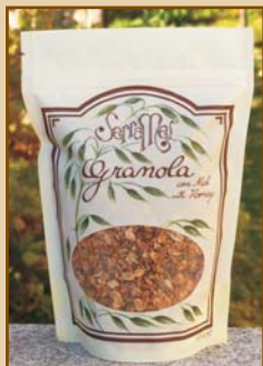
Granola Serramel (430g)